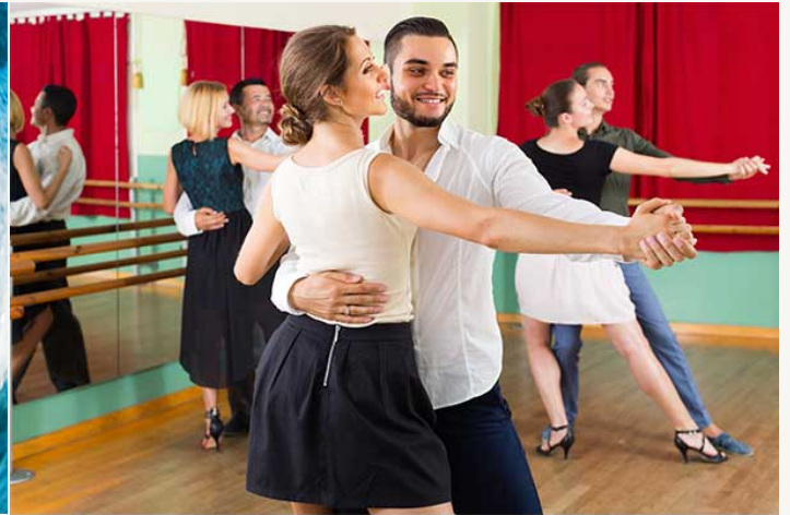
танці ( pl ) | займаються танцями