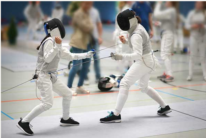
фехтування ( n, sg ) | займаються фехтуванням