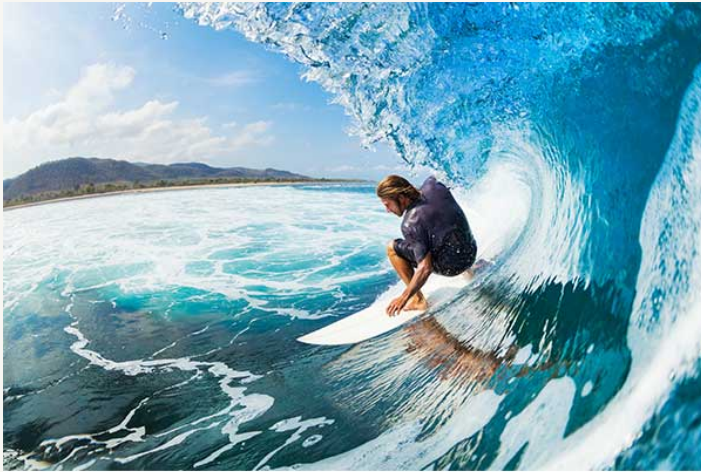
серфінг ( m, sg ) | займається серфінгом